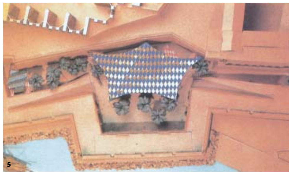
Εικ. 5,6. Οι λοξές χαράξεις, σε επίπεδο κάτοψης, υποστηρίζονται με το εντυπωσιακό στοιχείο της τέντας που στεγάζει ένα μεγάλο μέρος του χώρου.