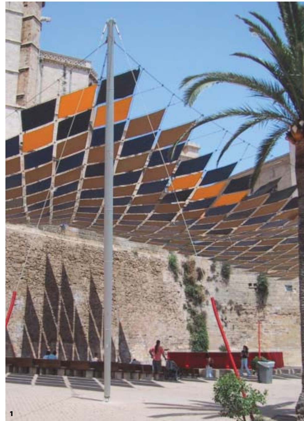
Εικ.1. Τα αποτελέσματα αυτού του εγχειρήματος είχαν επιτυχία και ο χώρος παραμένει ζωντανός και φιλόξενος ακόμα και σήμερα, 18 περίπου χρόνια μετά την επέμβαση του 1987. Σε αυτό το γεγονός συμβάλει η σωστή συντήρηση των κατασκευών, αλλά και ο σεβασμός των πολιτών προς το δημόσιο χώρο.

Ο τρίτος τομέας αποτελείται από μια σήραγγα, η οποία συνδέει το σταθμό με το λιμάνι. Η σιδηροδρομική σήραγγα που κατασκευάστηκε το 1932, οδηγεί στο τείχος μέσα από