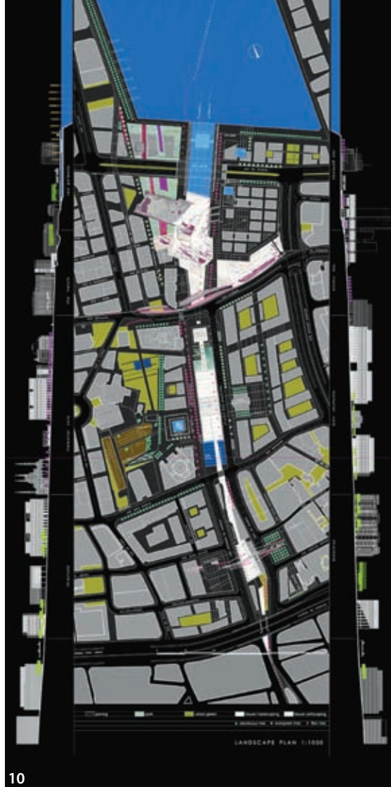
Εικ. 10. Ο διαγωνισμός του “Μεγάλου Άξονα και της Πλατείας Μαρτύρων” στη Βηρυττό, 2005.

Αλλά αυτό που θεωρώ ότι αποτελεί την κινητήρια δύναμη της εξέλιξης είναι η αμφιβολία, “το μοναδικό σταθερό σημείο μιας πιθανής εκκίνησης”, όπως χαρακτηριστικά διατυπώνει ο Giorgio Grassi. Την αμφιβολία που μου δίδαξαν οι δάσκαλοί μου και φίλοι, ο Δημήτρης Αντωνακάκης και ο Δημήτρης Φατούρος.