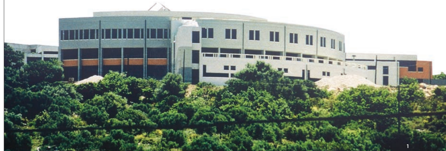
Εικ. 1,2. Βιβλιοθήκη Πανεπιστημίου Κρήτης στο Ρέθυμνο, 1991-1993.

Η λειτουργία της βιβλιοθήκης ωστόσο, ως πραγματικού αρχειακού χώρου αποθήκευ-